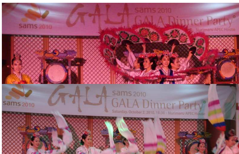
Südkorea forscht und feiert mit Grazer MedUni